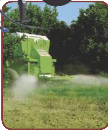
Planta Nova » Faixa