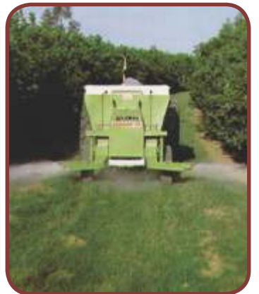
Adubação em Faixa

Equipamento protegido pelas patentes: PI9300926-7 e PI9500898-5