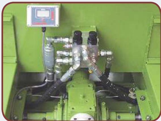
Facilidade de Regulagem

Permite a instalação de sistemas de aplicação a taxa variável, através de GPS.