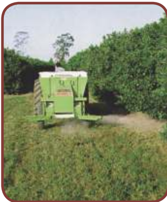
Finais de Rua » Morredouros