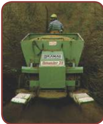
Palha de Café