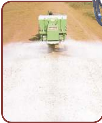
Calcário » Faixa Total