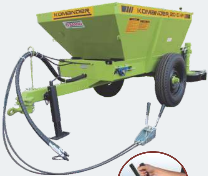
Comando mecânico das esteiras » Komander HP