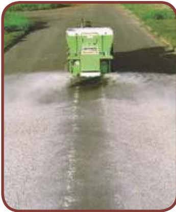
Calcário » Faixa Lateral

Cartão BNDES CARTÃO BNDES Produto Credenciado