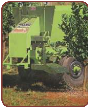
Intermitente » Planta Nova