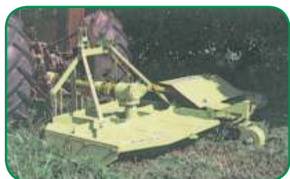
Serviço com Qualidade e Economia